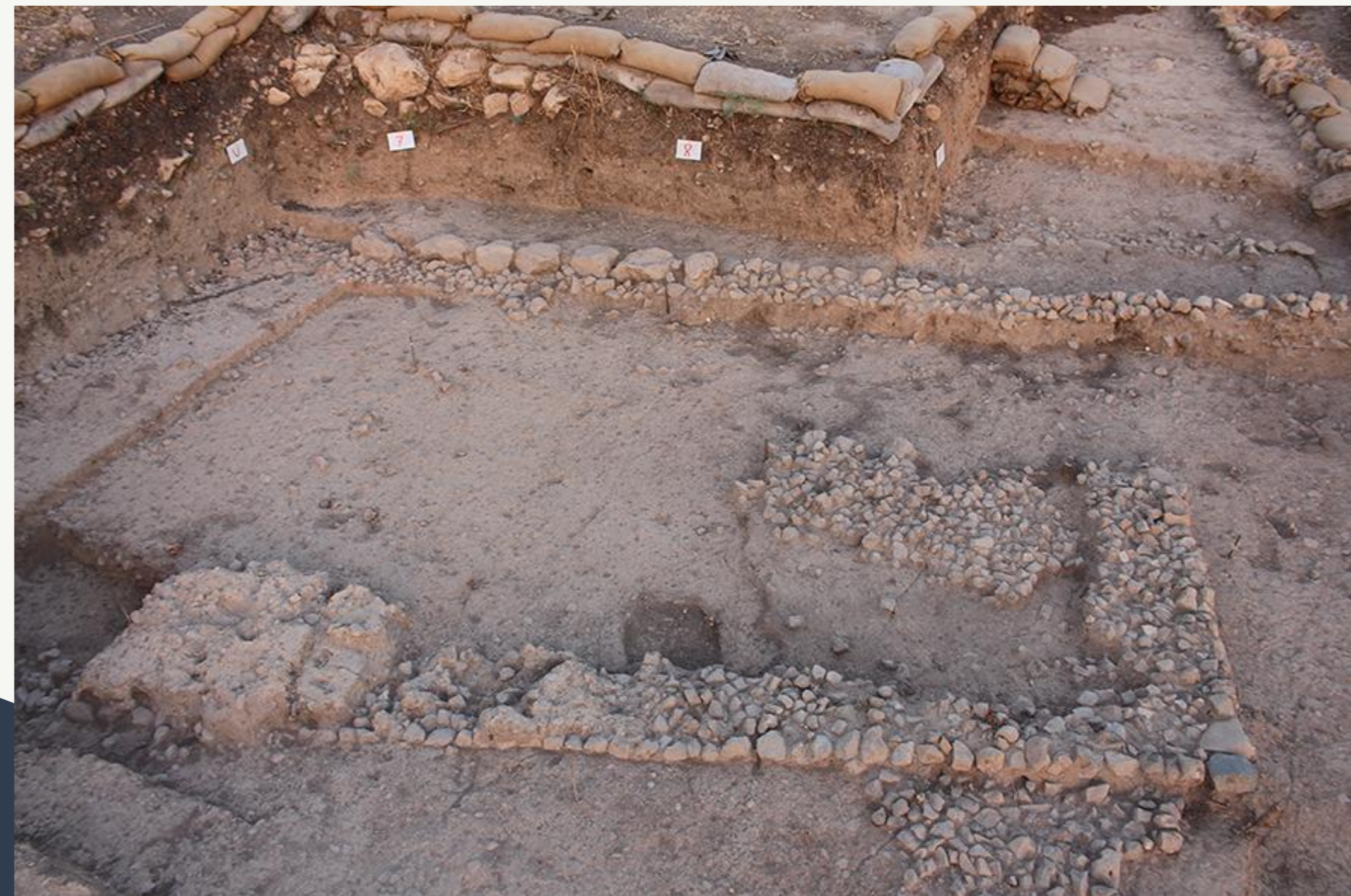
Fondations en pierre et mortier de chaux d'une structure du site néolithique précéramique de Beisamoun, 7ème millénaire, Israël