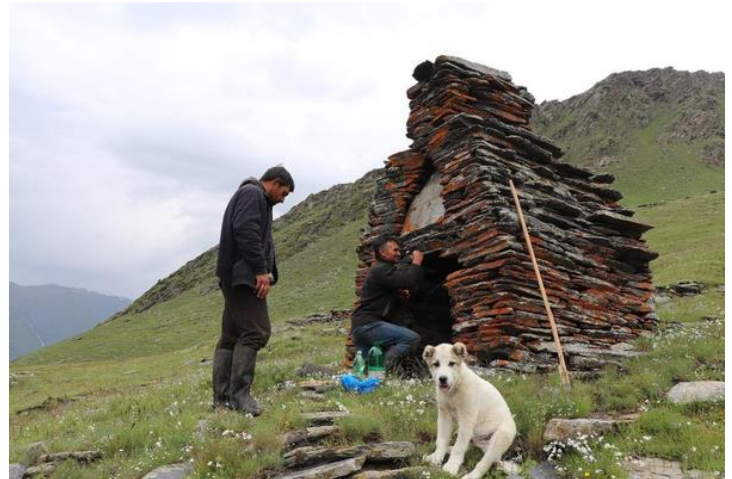
© Gwendoline Lemaitre - Paysages et modalités d'habitation en Géorgie occidentale