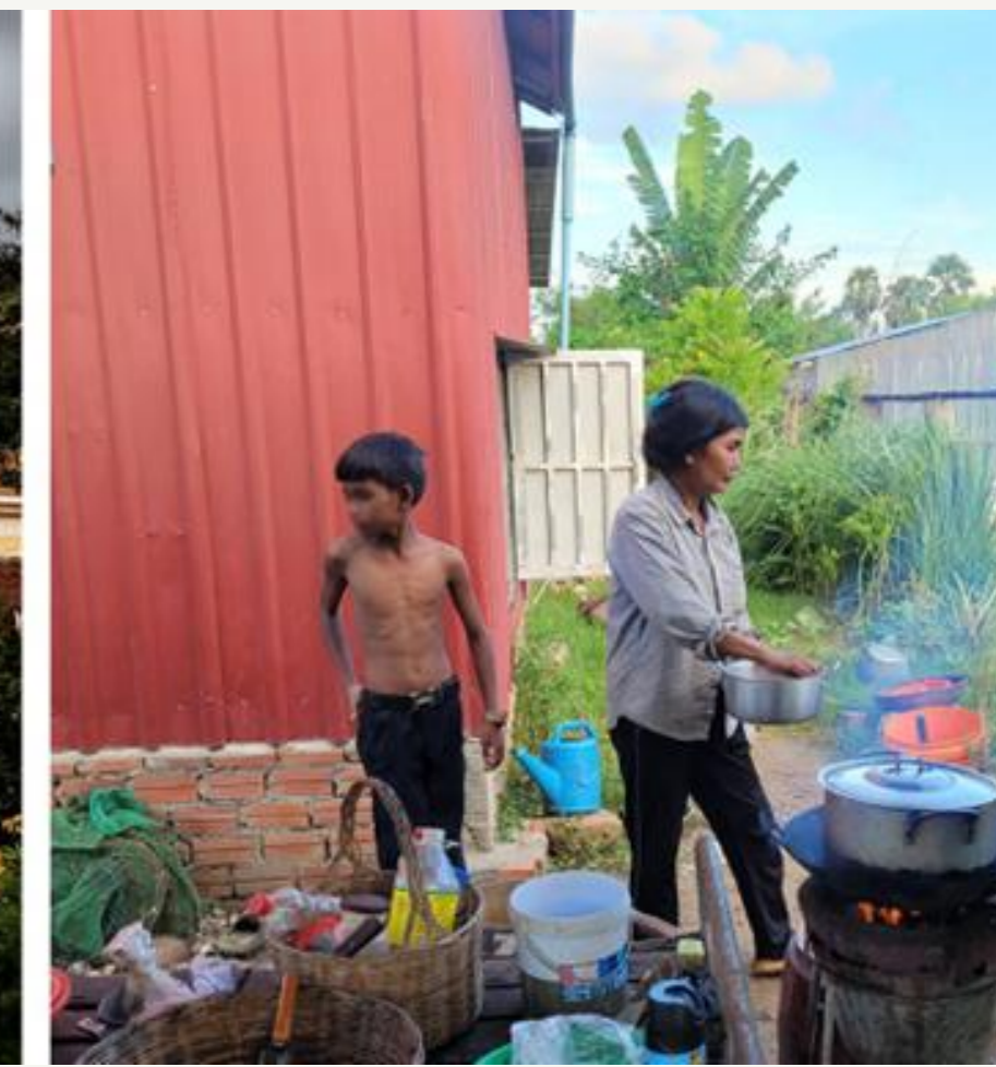
© Anne Yvonne Guillou - Pause-déjeuner, Phnom Penh-Battambang. Le palais royal à Phnom Penh avant la pluie de mousson. Préparation du déjeuner, village de Prek Chik, district de Bakan, province de Pursat. Octobre 2023